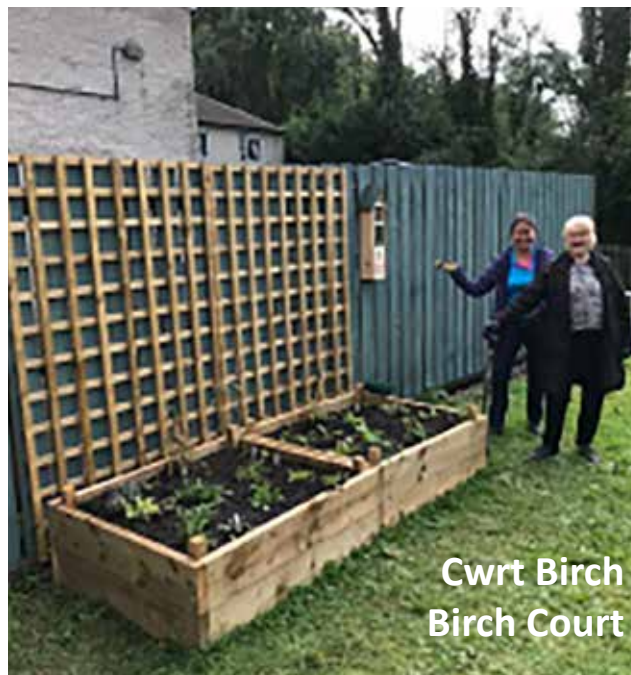
Cwrt Birch Birch Court

Defnyddiwyd cyfraniad y Grŵp i sefydliad Cadwch Gymru'n Daclus er mwyn helpu i ddatblygu Rhaglen Lleoedd Lleol ar gyfer Natur y sefydliad, a oedd yn cynnwys cynlluniau yng Nghwrt Birch a Chwrt Pine yng Nghaerdydd. Nod y rhaglen hon yw adfer natur mewn ardaloedd difreintiedig trwy ddyfarnu offer a deunyddiau er mwyn galluogi preswylwyr i greu gerddi natur newydd.