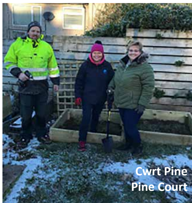
Cwrt Pine Pine Court